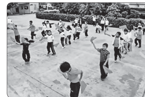
Incorporación de elementos al realizar una danza de la selva