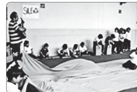
Ensamble del 1.º C. Vea la ubicación de los actores y del conjunto musical.