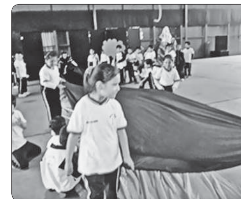
Ensamble del 1.º D. Vea a los músicos, actores y danzantes.