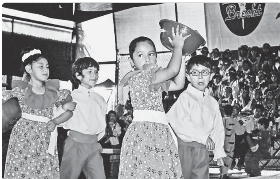
Los alumnos del 1.º C nos muestran la danza aprendida en clase: lavanderas y festejo.