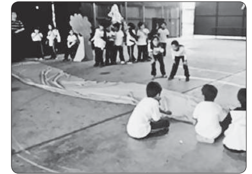
Alumnos del 1.º D representando una escena del cuento