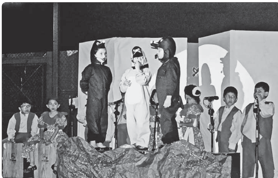
Panchito dialoga con sus padres y les dice que ya es grande y puede buscar su comida solito.