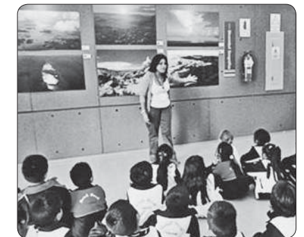
Visita al Museo de la Nación, donde pudimos contemplar fotografías e imágenes sobre la flora, la fauna y las poblaciones de la costa, sierra y selva peruana.