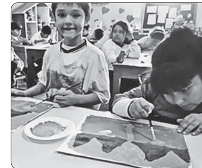
Alumnos pintando el paisaje de la sierra elegido y utilizando los colores primarios y secundarios. Pese a que nos guiamos de un mismo paisaje, cada uno le puso un detalle distinto.