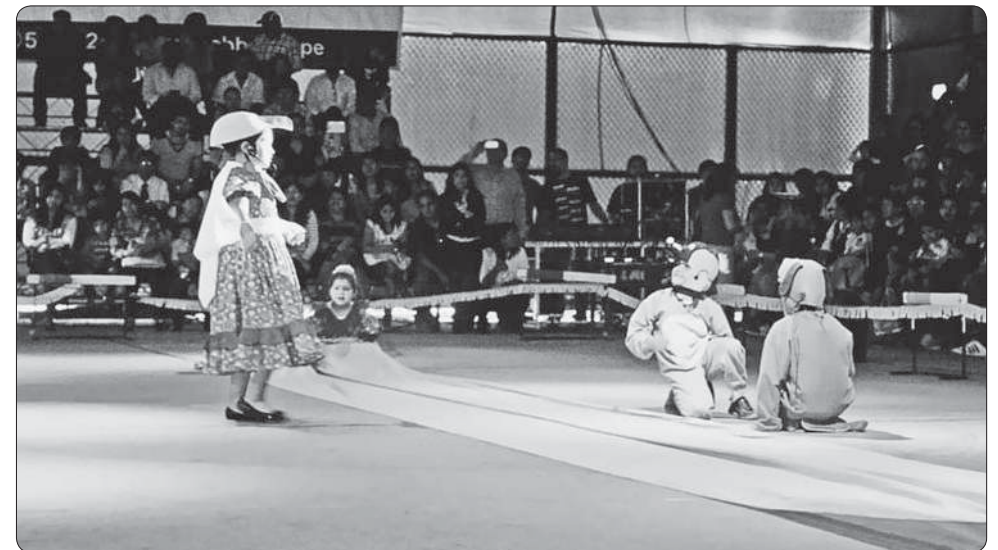
Gabi, la gaviota, cuenta a Bobby y a Panchito cómo la gente contamina las playas.