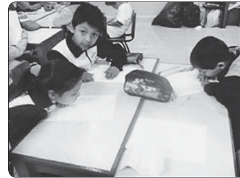
Lectura y elección del personaje con ayuda del maestro