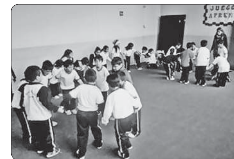
Se formaron círculos partiendo de la idea de que cada alumno era un punto.