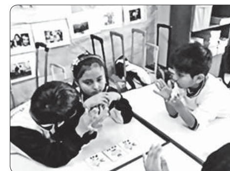
Para que cada grupo logre su objetivo, fue importante la mediación entre pares y la motivación entre ellos mismos.