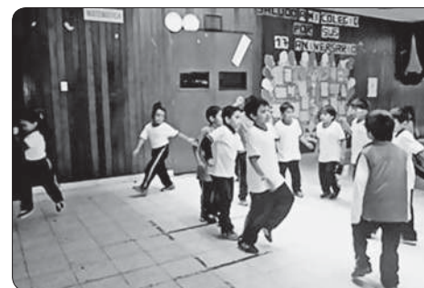
Secuencia coreográfica de una danza de la selva