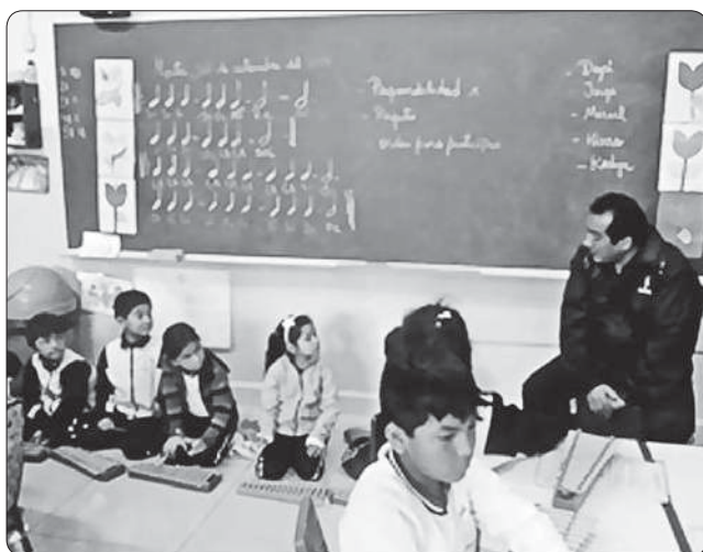
La incorporación del lenguaje musical permitió la autonomía de los alumnos y la conformación de conjuntos instrumentales.