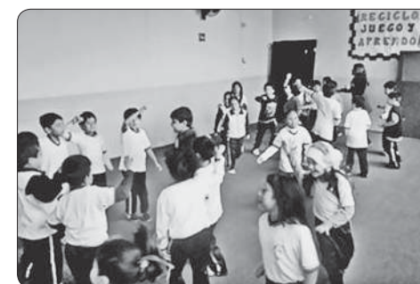
La formación de figuras con base de puntos (alumnos) nos ayudó a construir formas coreográficas para la danza.