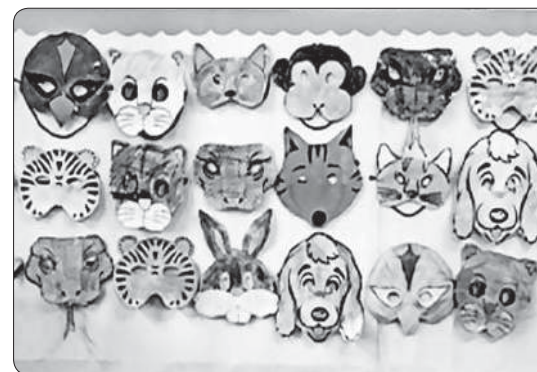
Máscaras elaboradas por los alumnos para representar pequeños cuentos