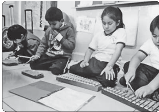
Se muestra al conjunto instrumental, donde cada estudiante tiene un rol.