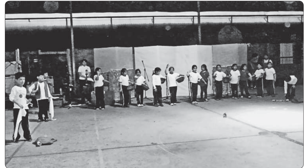
Contaminación en la costa. Las lavanderas ingresan a lavar su ropa al río causando contaminación.