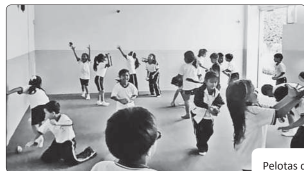
Pelotas de trapo

Los alumnos del primer grado se divierten en el aula de Arte experimentando con diversos elementos y utilizando las diferentes partes del cuerpo.