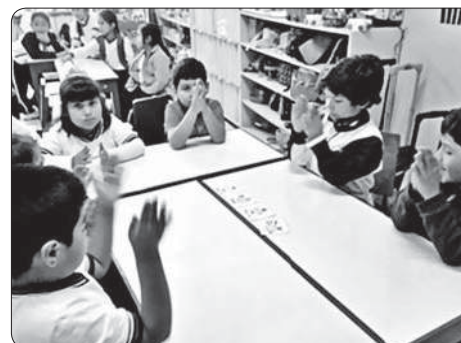
Ejecución grupal de una secuencia rítmica utilizando figuras musicales no convencionales.